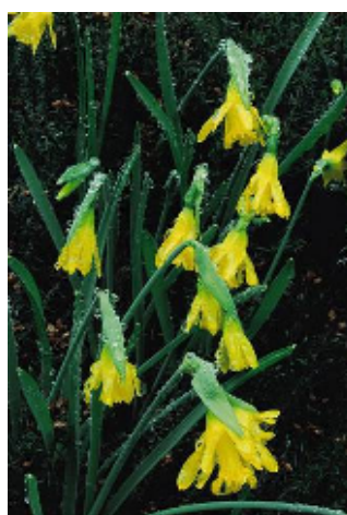
Narcisos de Asturias

Son precisamente este tipo de aprovechamientos los que permiten que las diversas comunidades específicas de estas formaciones se mantengan. En los abundantes pastizales de este área se conservan poblaciones de cuatro taxones incluidos en el Catálogo Regional de Flora Amenazada: la centaurea de Somiedo ( Centaurea somedanum ), como especie sensible a la alteración de su hábitat y el narciso de Asturias ( Narcissus asturiensis ), el narciso de trompeta ( Narcissus pseudonarcissus L. ssp. nobilis ) y la genciana ( Gentiana lutea ssp. lutea ), como especies de interés especial.