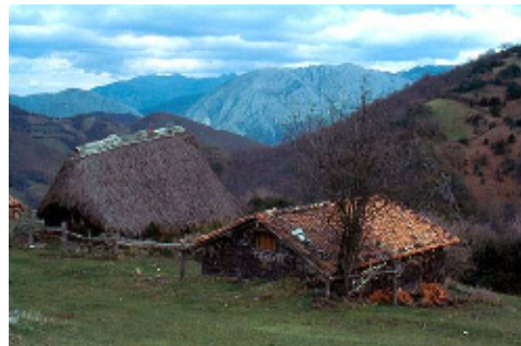
Braña de Tuiza

En los pueblos del entorno se pueden encontrar buenos ejemplos de la arquitectura tradicional de la montaña asturiana, con viviendas levantadas en mampostería pétreo y corredores de madera, en los que pueden apreciarse trabajos de talla. Junto a estos núcleos de población asentados en los valles coexistieron, las denominadas brañas, zonas de pasto de verano en áreas de mayor altitud en las que se construían sencillas cabañas de pie