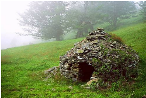
Braña de las Cadenas

A la vistosidad del paisaje y el buen grado de conservación de los recursos naturales de Las Ubiñas - La Mesa se añaden sus numerosos valores culturales. Entre éstos destaca su patrimonio arqueológico, dado que cuenta con una de las más ricas estaciones rupestres del noroeste peninsular, los Abrigos Rupestres de Fresnedo localizados en el entorno del pueblo de Fresnedo, en el concejo de Teverga. Se trata de un conjunto de cinco covachos con numerosas representaciones pictóricas datadas de la Edad del Bronce - Edad del Hierro. De la época castreña se conservan restos de castros en la Focella y Barrio (Teverga), así como en La Picona en Ricabo y El Collao (Quirós). Sin duda uno de los elementos representativos de esa zona es el Camino Real de La Mesa, calzada romana que discurría por la cresta de los cordales que hoy delimitan los concejos de Somiedo y Teverga (Cordal de La Mesa), así como los de Belmonte de Miranda y Grado (Cordal de Porcabezas). Esta vía, quizá tan antigua como los primeros indígenas astures, comunicaba los principales pueblos romanos de Asturias con los de la Asturica Augusta (Astorga).