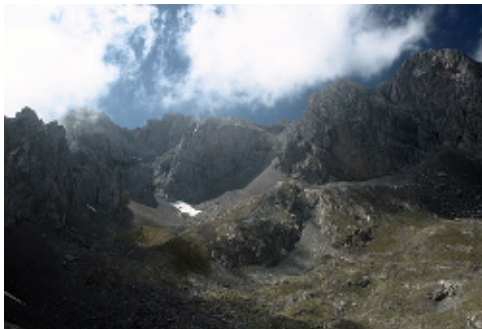
Valle glaciar de los Joyos de Cueva Palacio

El sustrato geológico de esta zona está constituido exclusivamente por formaciones paleozoicas, con edades que van desde el Cámbrico inferior al Carbonífero superior, presentando una fuerte alternancia de tipos litológicos de naturaleza predominantemente calcárea y mixta.