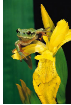
Ranita de San Antón

Destacar la presencia de rana de San Antón ( Hyla arborea ) en la zona de los puertos de Agüeria y de rana común o rana verde ( Rana perezi ) en la zona del puerto de La Cubilla. Ambas especies se incluyen en el Catálogo Regional de Especies Amenazadas. Por último, entre los invertebrados destaca la presencia del caracol de Quimper ( Elona quimperiana ), de la libélula Aeshna juncea , del ciervo volante ( Lucanus cervus ) o de la mariposa Parnassius apollo