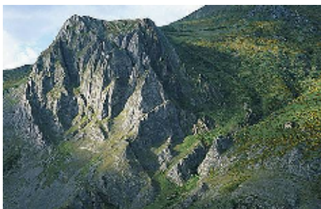
Parque natural de Fuentes del Narcea, Degaña e Ibias

El Parque integra por tanto un conjunto de sierras y valles que por su escaso poblamiento y acusado relieve conservan aun importantes masas forestales autóctonas. La conveniencia de una protección legal del espacio ya había sido señalada finalizando el siglo XIX por Bellmunt y Canella, que en su obra Asturias proponían la creación de un Parque Nacional que tomara por modelo el de Yellowstone declarado en los Estados Unidos de Norteamérica en 1897.