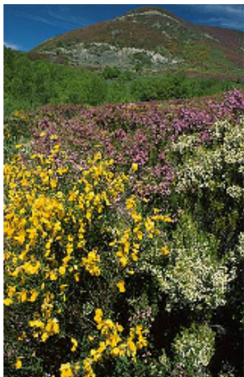
Primavera en el Monasterio de Hermo

Por último, debe citarse la presencia de bosques y retazos de bosque de rebollo ( Quercus pyrenaica ), que se sitúan en las áreas de menor pluviosidad: las laderas orientadas a solana del Monte de Muniellos y las de idéntica orientación de la Sierra de Degaña, siempre en zonas de baja altitud.