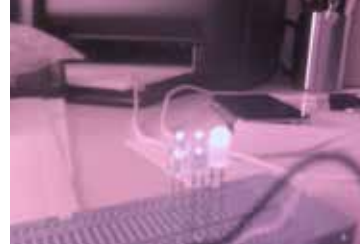
Visión de los LED con y sin infrarrojos.