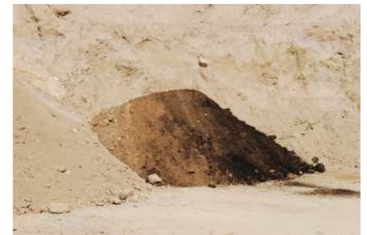
Serie Situaciones de emergencia , 2013. Diapositivas proyectadas.

anticipada. En la serie de diapositivas Situaciones de emergencia se proyectan simultáneamente imágenes idílicas de lugares donde se han realizado simulacros de emergencia y, por otro lado, accidentes y detalles amenazantes de esos lugares, convertidos en zonas de riesgo. El paisaje de la rotopaca o rulo de hierba seca y flores es en realidad una naturaleza muerta y el vídeo con el secador de pelo oscilante, un autorretrato en negro riguroso, que pasa del reposo al movimiento y a la inercia, tiene en su cadencia pendular algo que recuerda los últimos actos reflejos del ahorcado.