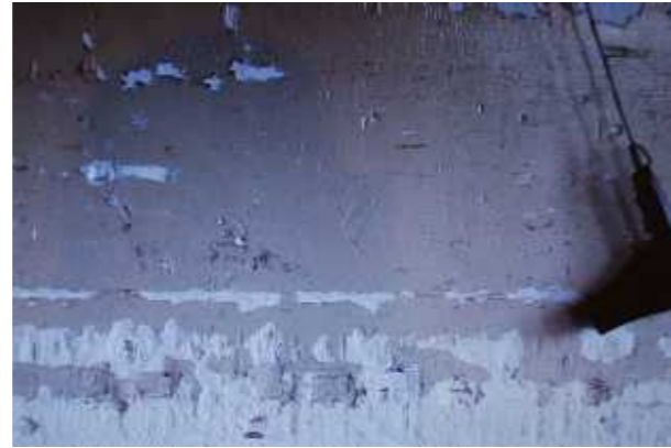
Selfportrait , 2013. Vídeo de 7 minutos de duración.