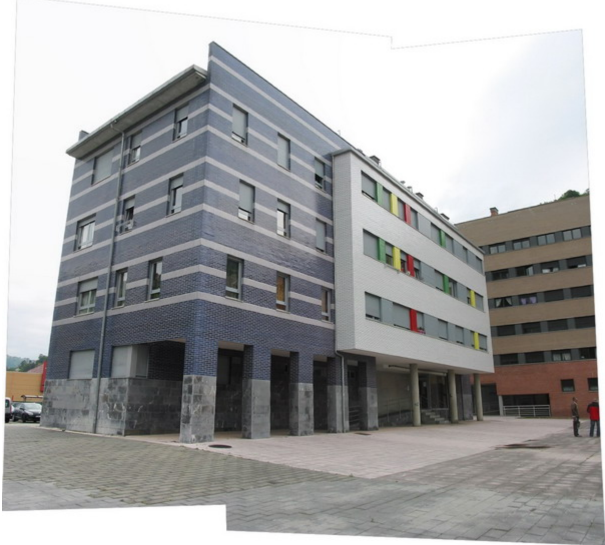
Fachada del edificio desde la plaza.