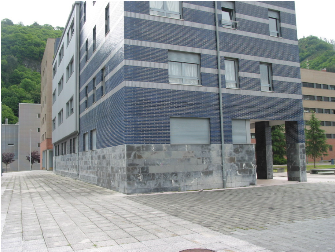
Fachada posterior del local.