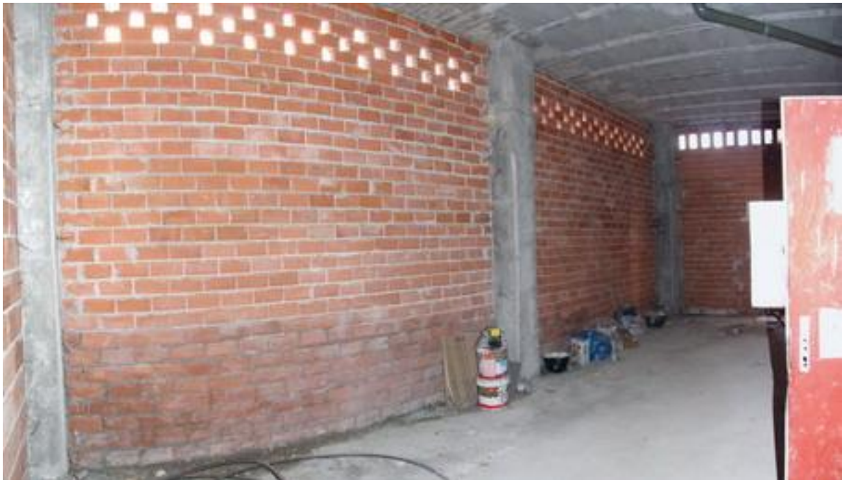
Interior del local hacia la entrada.