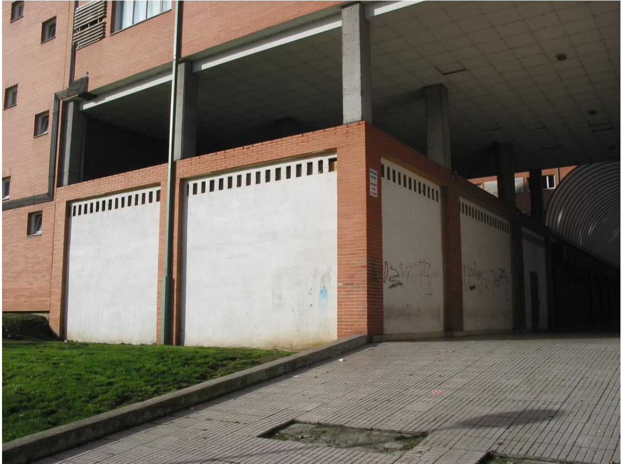
Exterior desde el Polideportivo "Yago Lamela"