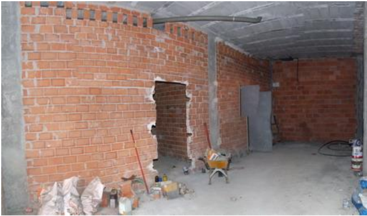
Interior desde la entrada