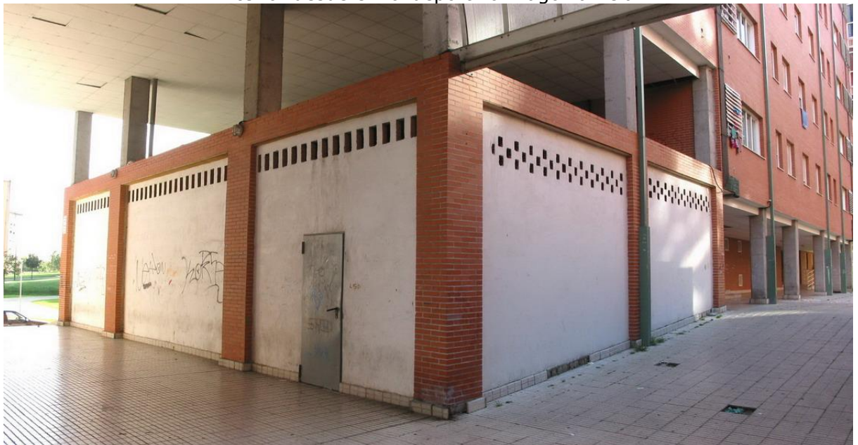
Exterior del local desde los espacios interiores.