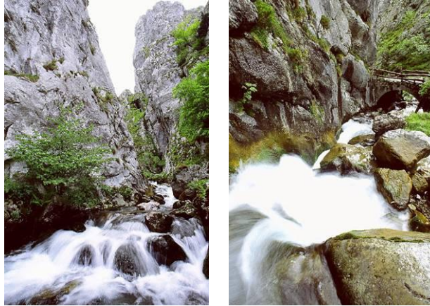
Foces del río Pino

En la zona intermedia, superadas las hoces, domina un extenso hayedo a ambos lados del valle; el resto de la superficie se reparte entre brezales y pastizales, así como ricas praderías que ocupan los mejores terrenos de las vaguadas y cordales, desde 1.100 m las más altas, hasta 700 m en el fondo del valle. En este tramo hay abundancia de avellanos ( Corylus avellana ) y escasos rodales de roble albar ( Quercus petraea ).