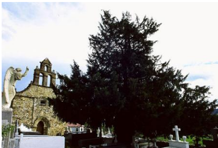
Tejo de Salas

Sólo eso, ha servido para estimular la imaginación de los cronistas locales que han mencionado el papel de la taxina en primitivos aquelarres, el envenenamiento de las puntas de las flechas que los astures lanzaron sobre las tropas de Augusto y el carácter mágico del tejo para los primitivos celtas, carácter que los primeros cristianos quisieron amortiguar emplazando en los lugares sagrados de los paganos ermitas y capillas. Lo cierto es que de todo ello poco se sabe, pero aún hoy es frecuente la conjunción de pequeñas ermitas a la sombra de tejos centenarios.