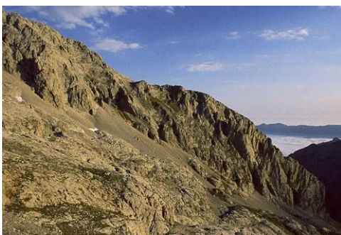
Amanecer en la vega de Urriellu

Su desarrollo total sobrepasa los cuatro kilómetros y en él se pueden diferenciar dos sectores. Uno vertical formado por pozos y otro inferior formado por una galería fósil de casi cincuenta metros de sección y un río subterráneo, el Río del Silencio , que se sume en un sifón terminal con dos posibles salidas: las fuentes de Bulnes o el manantial del Farfao de la Viña, que es también resurgencia del sistema del Trave.