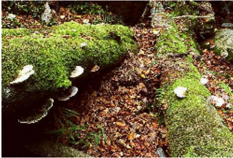
Hayedo de la Biescona

Hacia la vertiente norte, en el paraje de la Biescona, se conserva un hayedo eútrofo extraordinariamente conservado y que probablemente constituya la masa de hayas más cercana al mar y de menor altitud de Asturias, favorecida sin duda por el notable efecto barrera que para los frentes oceánicos supone el promontorio calizo del Sueve. Muy cerca se sitúa también una de las principales masas de tejo de la región, bosque de notable valor por ser rara su existencia a pesar de la frecuencia con que el tejo participa de otros tipos de bosque.