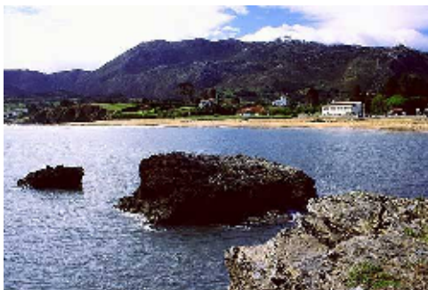
Sierra del Suevo desde La Isla

El Paisaje Protegido de la Sierra del Suevo constituye un resalte topográfico de orientación suroeste-nordeste, bien delimitado entre las áreas llanas de las rasas costeras y el surco prelitoral, que se extiende hacia la depresión central de Asturias. Su carácter de promontorio rocoso en un área sustancialmente llana le confiere un papel principal en la definición del paisaje del oriente asturiano.