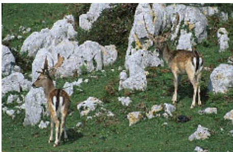
Machos de gamos

La cabaña ganadera, vacas, cabras, ovejas, caballos y potros, comparten el espacio de las laderas del Sueve con la fauna salvaje. Destaca entre todos el asturcón, raza de caballo semisalvaje que, tras pasar un periodo en que su supervivencia se vio seriamente amenazada, ha conseguido estabilizar su población.