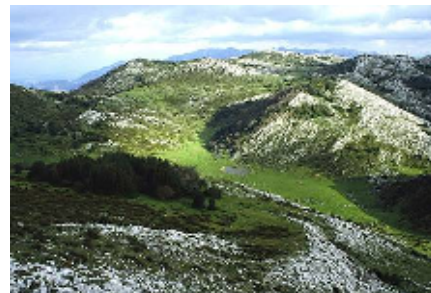
Vista desde el Pico Caldoveiro

En el territorio del Paisaje Protegido pueden diferenciarse cuatro grandes unidades geográficas. La primera, en el centro, es la formada por el kárst de los puertos de Marabio, situado a caballo de los concejos de Teverga y Yernes y Tameza. En esta zona apenas existe poblamiento, sin embargo se trata de un área de intenso pastoreo utilizada por los vecinos de Teverga y Yernes y Tameza.