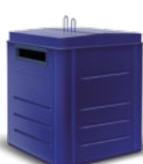
PAPEL Y CARTÓN